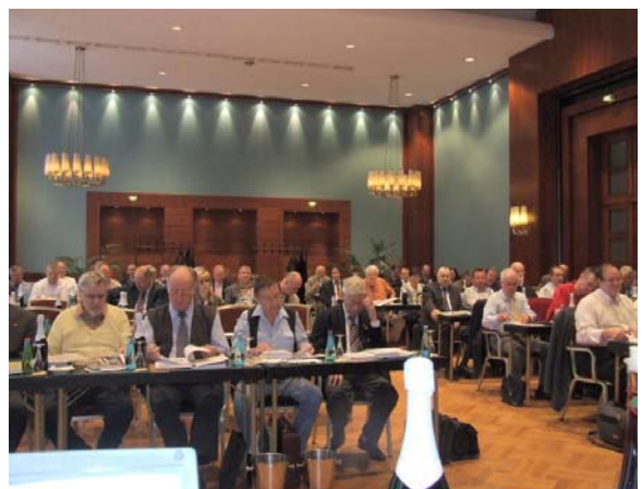
Die Delegierten der Landesverbände